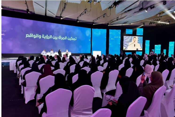
Légende: Rencontre dans le cadre du Women Empowerment Program, initiative du Ministère des communications et des technologies de l'information du Royaume d'Arabie saoudite

Le Women Empowerment Program, initiative lancée par le Ministère des communications et des technologies de l'information du Royaume d'Arabie saoudite, est un programme national qui vise à permettre à tous, en particulier aux femmes, de bénéficier de formations dans le domaine des technologies émergentes et à donner des moyens d'agir à des champions du numérique.