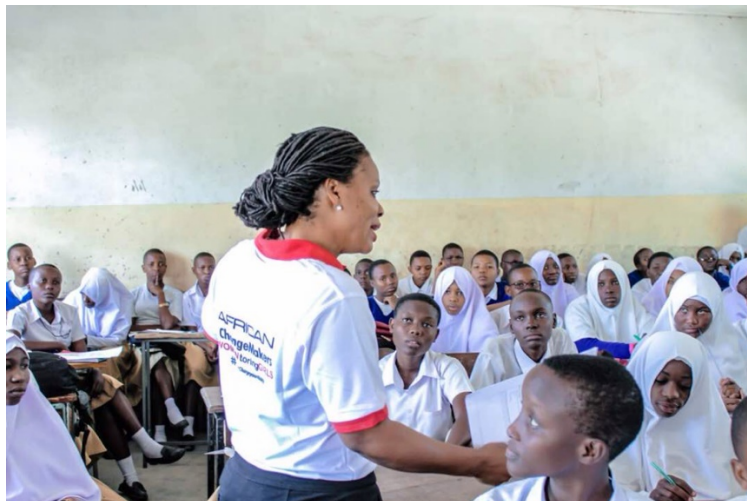
Légende: Un mentor de l'initiative African Changemakers travaille avec les élèves pour les aider à mettre à profit les compétences numériques afin d'offrir des débouchés

ROLE DIRECTEUR POUR LES PME: cette catégorie récompense des personnes et des initiatives qui ont pour but de promouvoir le rôle des femmes à des postes à responsabilités ainsi que l'entrepreneuriat féminin dans les petites et moyennes entreprises (PME) du secteur des technologies. Le Centre du commerce international, qui compte parmi les partenaires ayant créé le Partenariat EQUALS, a remis le prix "EQUALS in Tech" dans la catégorie "Rôle directeur pour les PME" à l'initiative African Changemakers .