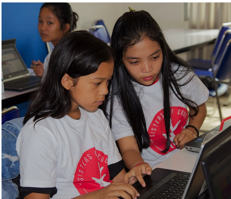
Légende: Des jeunes filles développent ensemble leurs compétences numériques au sein de Sisters of Code, premier club de codage féminin du Cambodge

COMPETENCES: cette catégorie vise à récompenser les personnes et les initiatives ayant pour but d'appuyer le renforcement des compétences des femmes et des jeunes filles dans les domaines des sciences, des technologies, de l'ingénierie et des mathématiques, afin de leur permettre de participer pleinement à la société dans un monde où le numérique se généralise. L'UIT, qui compte parmi les partenaires ayant créé le Partenariat EQUALS, a remis le prix "EQUALS in Tech" dans la catégorie "Compétences" à Sisters of Code .